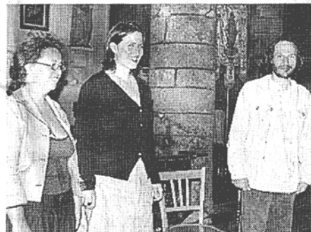
Les spectateurs ont été conquis par la prestation de l'ensemble Les Faux Bourdons.